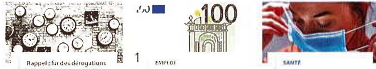
Présentation par le service communication du nouveau site Internet du CDG77